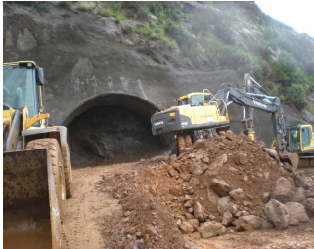
T2 Tünel Kazısı