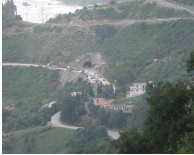
T3 Tüneli Genel Görünüm

Bejaia Karayolu Projesi'nde 290 m uzunluğundaki T3 tünelinin kazısı tamamlanmak üzeredir ve 611 m uzunluğundaki T2 tünelinin kazısına başlanmıştır.